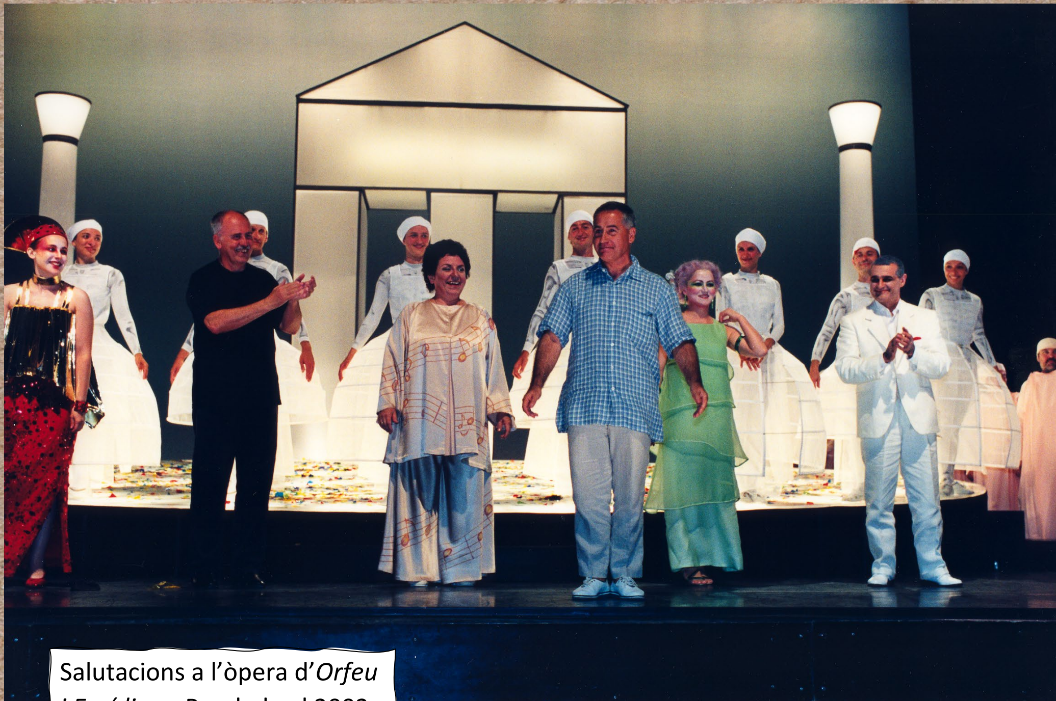
Salutacions a l'òpera d' Orfeu i Eurídice a Peralada el 2002