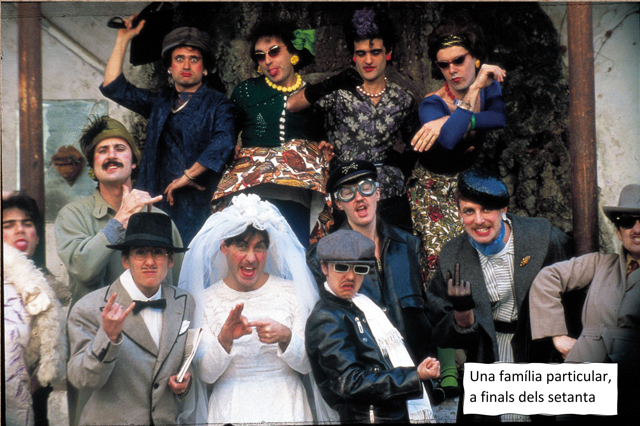
Una família particular, a finals dels setanta