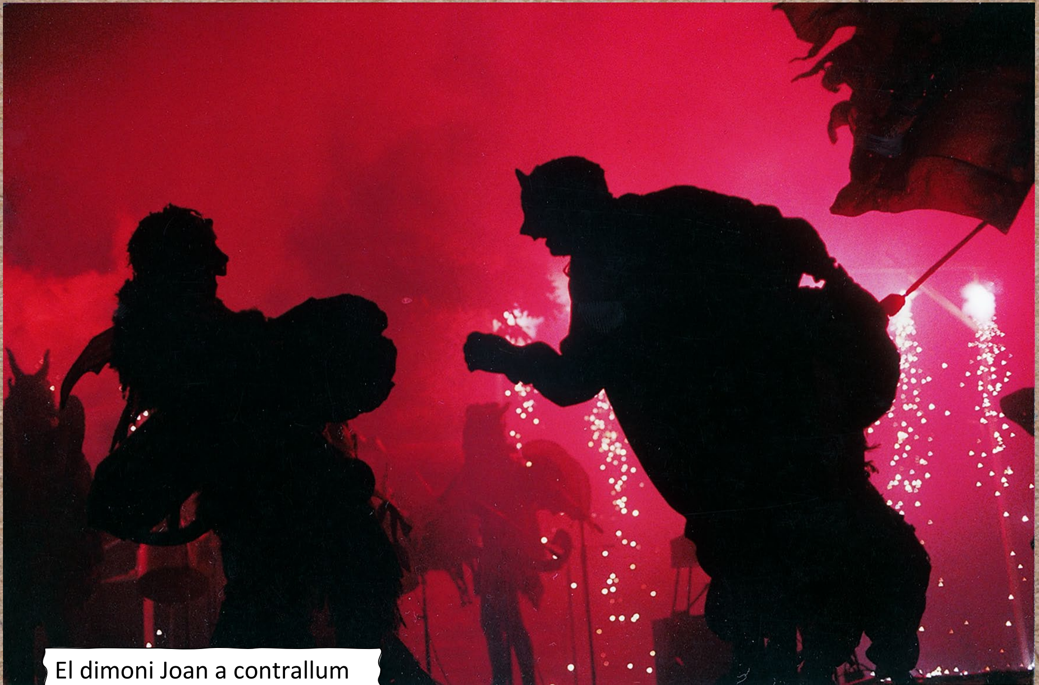
El dimoni Joan a contrallum