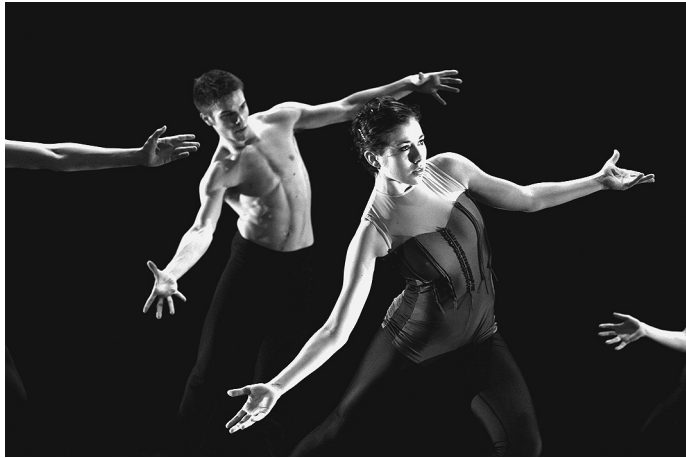
Ilike five. Coreògraf: Stijin Celis. Estrenada al Teatre del Mercat de les Flors el 7 de juliol de 2009 dins del Festival Grec 2009.

va: un pati de butaques a vessar va aplaudir d'allò més el desfet d'art i d'energia. 6