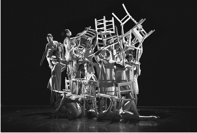
WHIM Fractured Fairytale. Coreògraf: Alexander Ekman. Estrenada per IT Dansa al Teatre Ovidi Montllor dins del Festival Grec 2007.