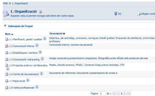
Gestor documental en alfresco