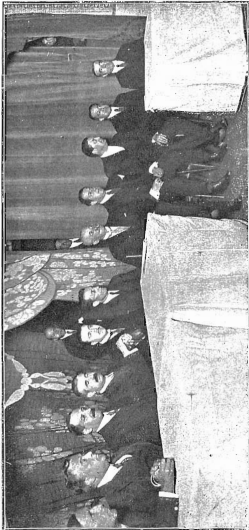
PRESIDÈNCIA DE LA SESSIÓ INAUGURAL DEL CURS 1917-18