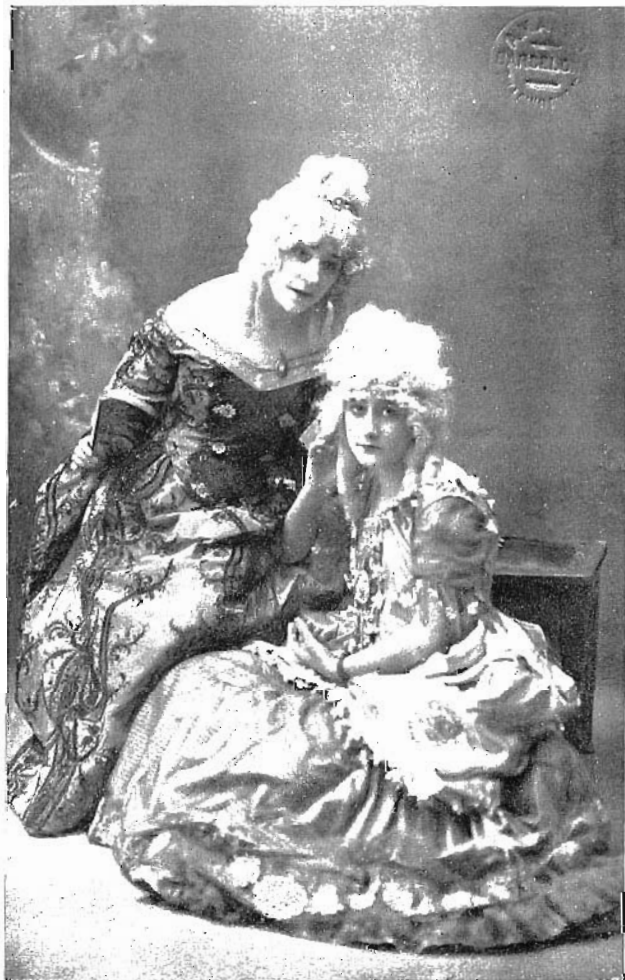
« LA MARE CONFIDENT »