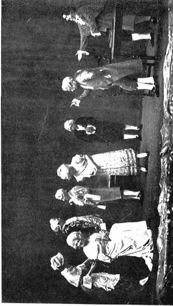
UNA ESCENA D'«EL SORRUT BENEFACTOR», DE GOLDONI