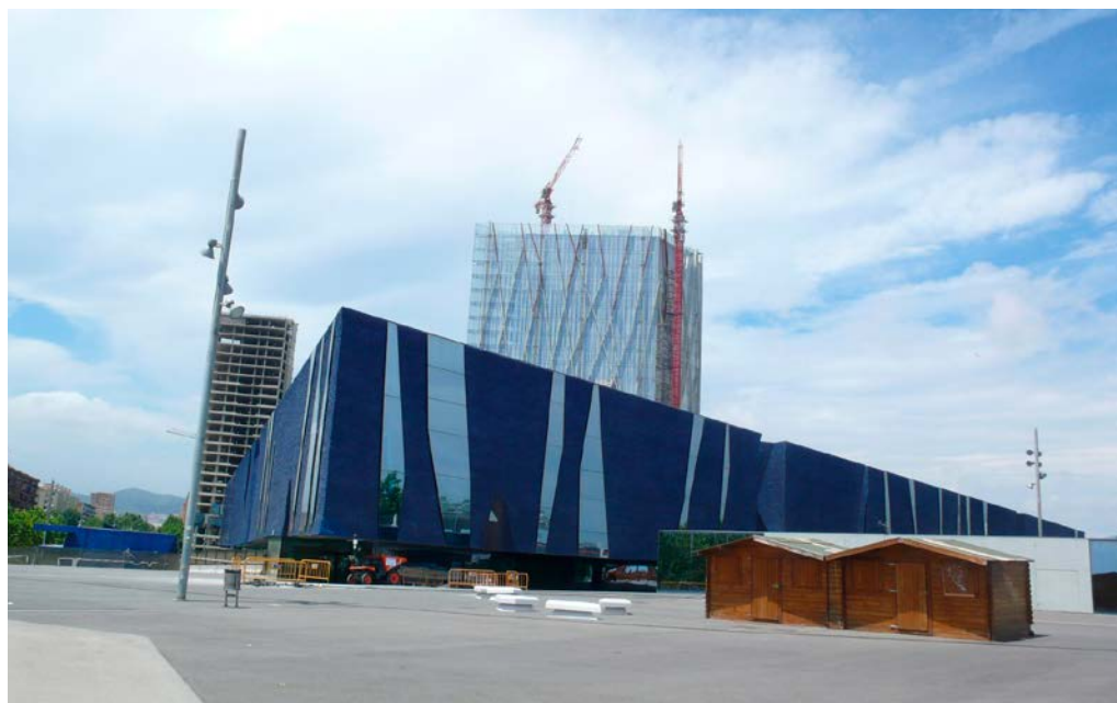
Un espacio amnésico: piezas arquitectónicas como el volumen triangular (ahora Museu Blau) de los arquitectos suizos Herzog y De Meuron enmarcan la explanada del Fòrum 2004 de Barcelona, espacio donde se encontraba el Camp de la Bota.

inauguraron esperanzas de que, a largo plazo, podrá llegar a concretarse una articulación simbólica en el mismo lugar, capaz de reconstruir su identidad dolorosa e integrarla en una nueva capa urbana al actual contexto de ocio, producto del urbanismo especulativo sin memoria de inicios del siglo XXI.