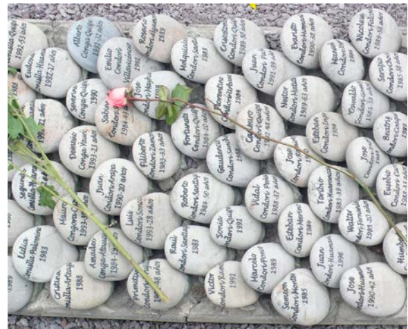
Las piedras que forman el laberinto con los nombres de las víctimas inscritos, colocadas alfabéticamente. Foto © Kathrin Golda-Pongratz, 2010.

El centro de la obra consiste en una enorme piedra encontrada por la artista cerca de un cementerio prehispánico en el norte del país, seguramente descartado en su momento por saqueadores de tumbas. Como tal, es también un símbolo de la falta de respeto hacia las culturas prehispánicas en el Perú. Alrededor de la piedra se han colocado en forma de laberinto unos 40.000 cantos rodados, en los cuales están inscritos los nombres de todas las víctimas. Un espacio escultórico que, no obstante, está en peligro constante mientras no se produzca una reconciliación que sea capaz de transformar la memoria en actos, acciones, encuentros y homenajes que permitan superar el dolor y hacer justicia. En distintos momentos ha sido atacado y parcialmente destruido por personas cercanas o pertenecientes al fujimorismo. La