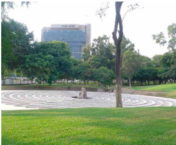
El laberinto de cantos rodados orientados alrededor del Ojo que llora , escultura de la artista Lika Mutal en el Campo de Marte de Lima.

Entre los memoriales contemporáneos y contestados en Lima, la obra El Ojo que llora , de la escultora holandesa Lika Mutal, ubicado en el Campo de Marte representa una nueva era a varios niveles y a la vez una batalla continua por la memoria. Es, en primer lugar, una intervención de radical reinterpretación de un espacio monumental relacionado, tradicionalmente, con las guerras «clásicas», como la defensa de Perú en la guerra contra Ecuador o la batalla de Ayacucho, y contra los héroes del país; es una obra escultórica que invita a acercarse y entrar en ella; y es el primer espacio monumental en la ciudad de Lima que actúa como espacio de memoria de la violencia interna que sufrió el país entre 1980 y 2000 y como homenaje a las víctimas del terrorismo de Sendero Luminoso. 9