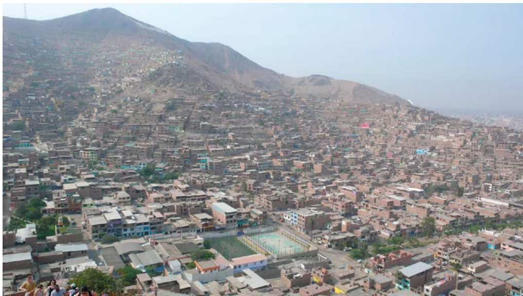
El barrio de El Ermitaño, surgido de la invasión en los años sesenta de la zona norte de Lima, en la actualidad. Más allá de la ciudad autoconstruida consolidada, se han producido nuevas invasiones que se colocan en zonas vulnerables.

de El Ermitaño, que documentó su fundación a base de una toma de tierra y su posterior desarrollo apoyado por el Gobierno de la época y las Naciones Unidas. 12 En 2016, dicho documental es proyectado por primera vez en el lugar donde fue filmado. Así empieza un proceso de activación de memoria dirigido por la autora, que, acompañado por talleres y largas entrevistas, da inicio a la producción de un nuevo documental que recoge las voces de los habitantes actuales. Ciudad Infinita – Voces de El Ermitaño (2018) 13 reactiva la memoria de los orígenes de un barrio autoconstruido y de sus múltiples identidades de origen migratorio.