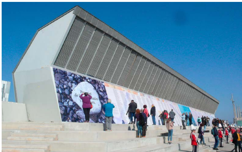
Acto municipal de inauguración de la instalación con los 1.706 nombres en el espacio del Fòrum de Barcelona el 24 de febrero de 2019.

una revisión urbanística que permita un proceso de creación de lugar en un sentido geddesiano , que aniquile su carácter amnésico actual, que integre los factores técnicos, sociales, históricos y culturales que lo definen y que sea aprobado por la ciudadanía.