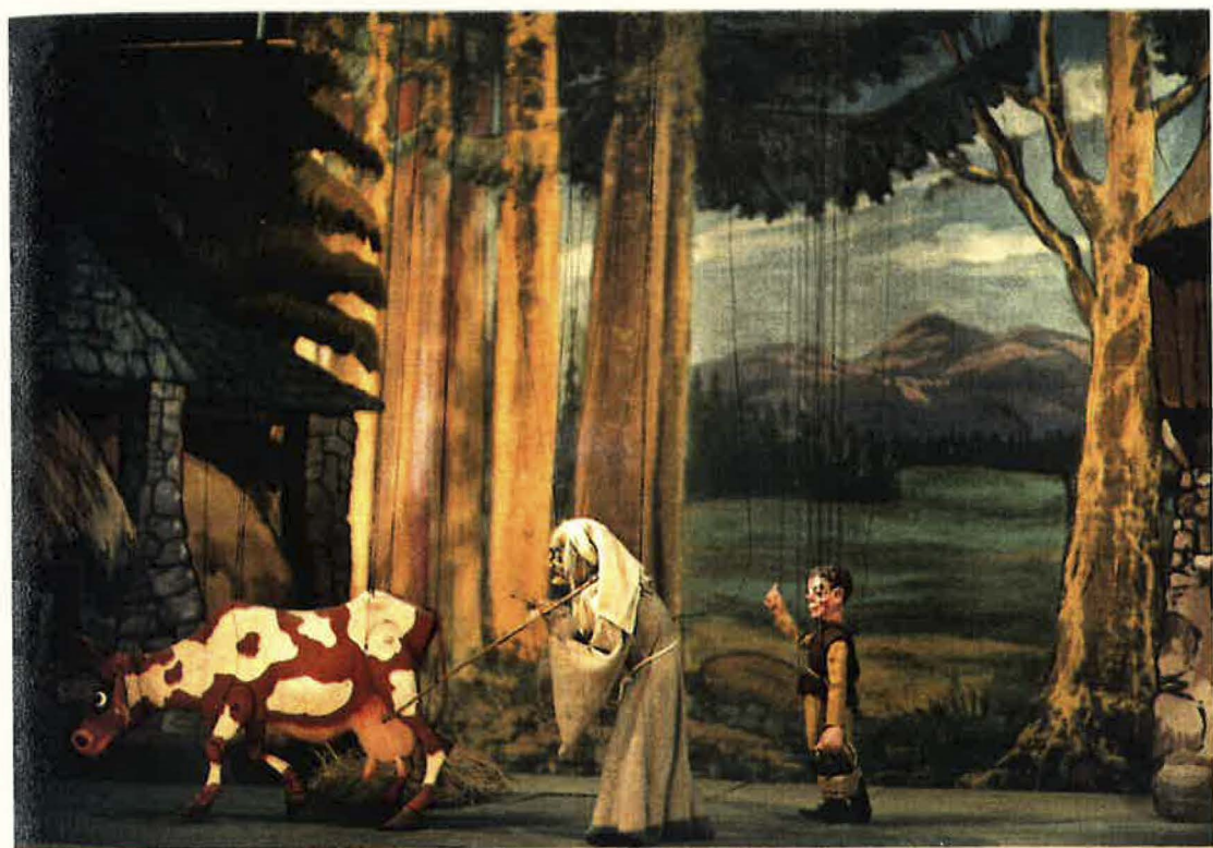
ESCENA DEL PRIMER ACTO, DE LAS HABICHUELAS MAGICAS: JUANITO CAMBIA LA VACA POR EL CESTO DE HABICHUELAS FOTO: TEREZA TRAVIESO Y H.V. TOZER

FOTO DE LA COLECCION EXPUESTA EN PUPPET THEATRE MUSEUM DE DOUGLAS HAYWARD ABBOTS BROWLEY RUGELEY CONDADO STAFFORDSHIRE