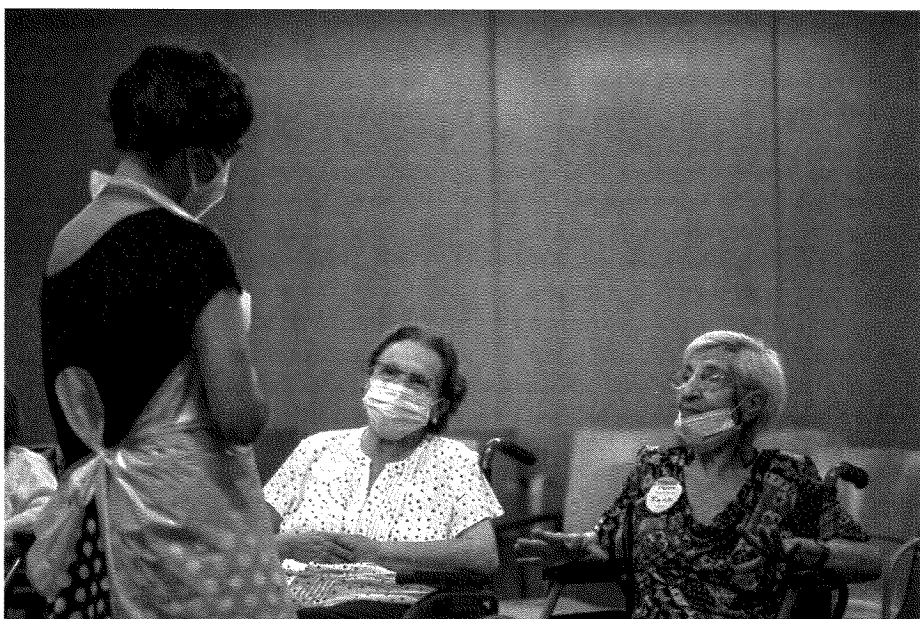
Imagen 1. Participantes del proyecto "El Museu s'Apropa".

Para dar respuesta a esa petición Apropa Cultura diseñó el proyecto el Museu s'Apropa (el Museo se Acerca) que se inició en septiembre de 2020. El personal del servicio educativo de los museos se trasladó a las residencias de gente mayor para organizar actividades artísticas para sus usuarios/as con diferentes situaciones vitales y afectaciones: post Ictus, demencia como la enfermedad de Alzheimer, patología mental, y diferentes grados de movilidad.