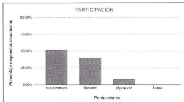
Figura 3. Gráfico de los porcentajes del indicador de participación de los usuarios/as. Elaboración propia.

· Resultados cuantitativos. Tal y como se puede observar en la figura 3, el 92 % de los grupos de usuarios/as participan muy a menudo y bastante, y el 8 % participa alguna vez durante las sesiones de danza. Se ha puntuado como participación cualquier respuesta directa verbal o de movimiento o indirecta como son micro-movimientos o la mirada.