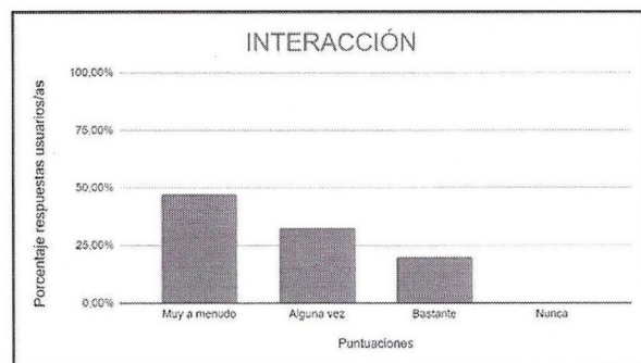
Figura 4. Gráfico de los porcentajes del indicador de interacción de los usuarios/as. Elaboración propia.

· Resultados cuantitativos. Tal y como se puede observar en la figura 4, en el 80 % de los grupos los usuarios/as interactúan entre ellos y en el 20 % interactúan bastante.