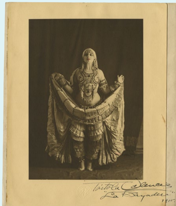
Vestit de Tórtola Valencia per la dansa La Baiadera fotografia signada per la ballarina i detalls del vestit, 1915. Vegeu detalls i més.