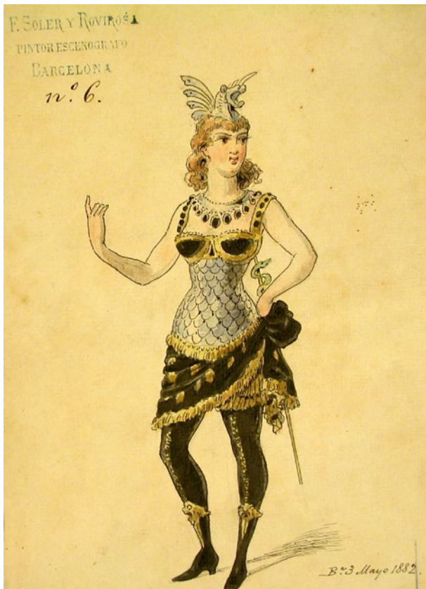
Figurí de Francesc Soler i Rovirosa i fotografia del vestuari per la ballarina Pauleta Pàmies, Lohókeli al Teatre Tivoli de Barcelona, 1882.