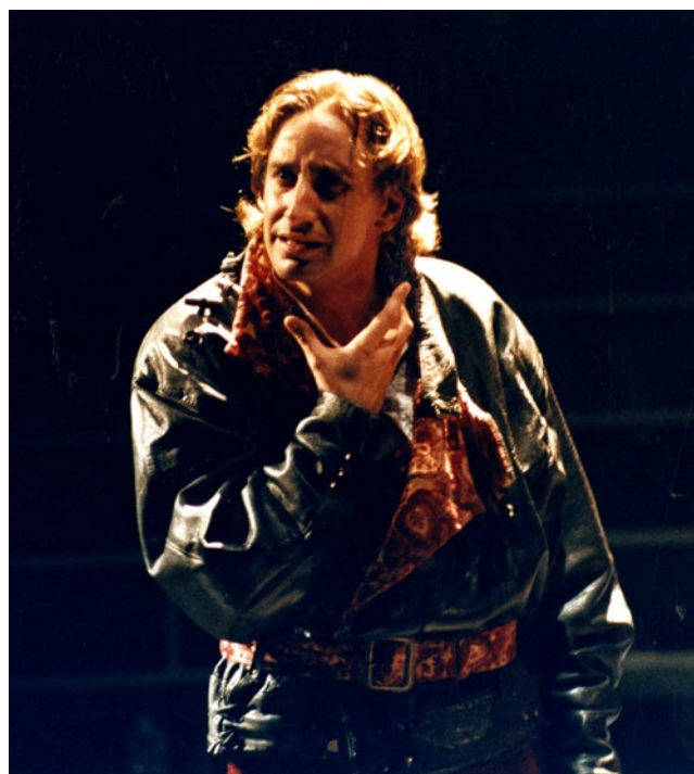
Figuri de Fabià Puigserver per Lorenzaccio i fotografia de Juanjo Puigcorbè al Teatre Lliure, Barcelona, 1987.