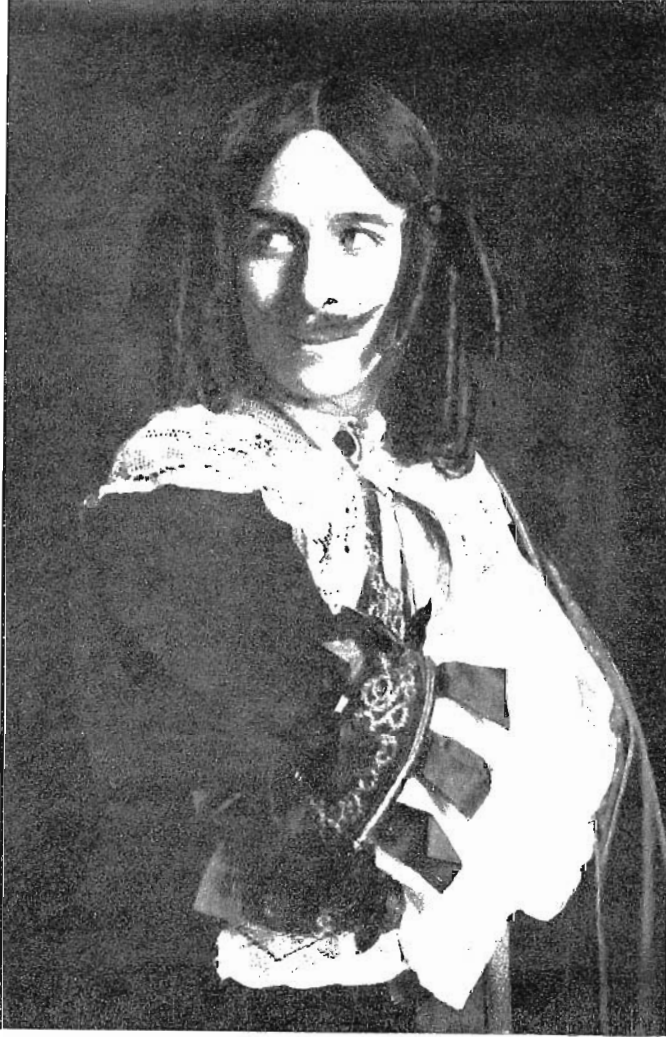
Beral: d'«EL MALALT IMAGINARI»