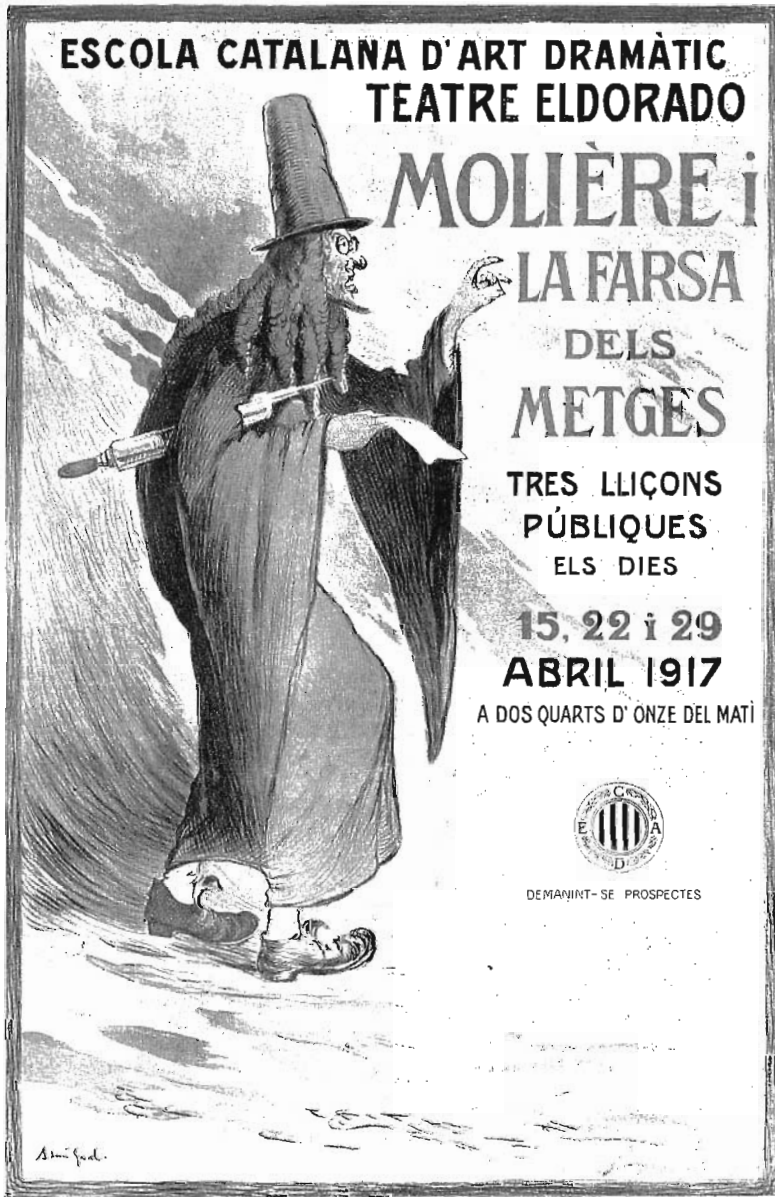
CARTELL ANUNCIADOR DE LA SÈRIE DE SESSIONS SOBRE «MOLIÈRE I LA FARSA DELS METGES», DIBUINAT PER ADRIÀ GUAL