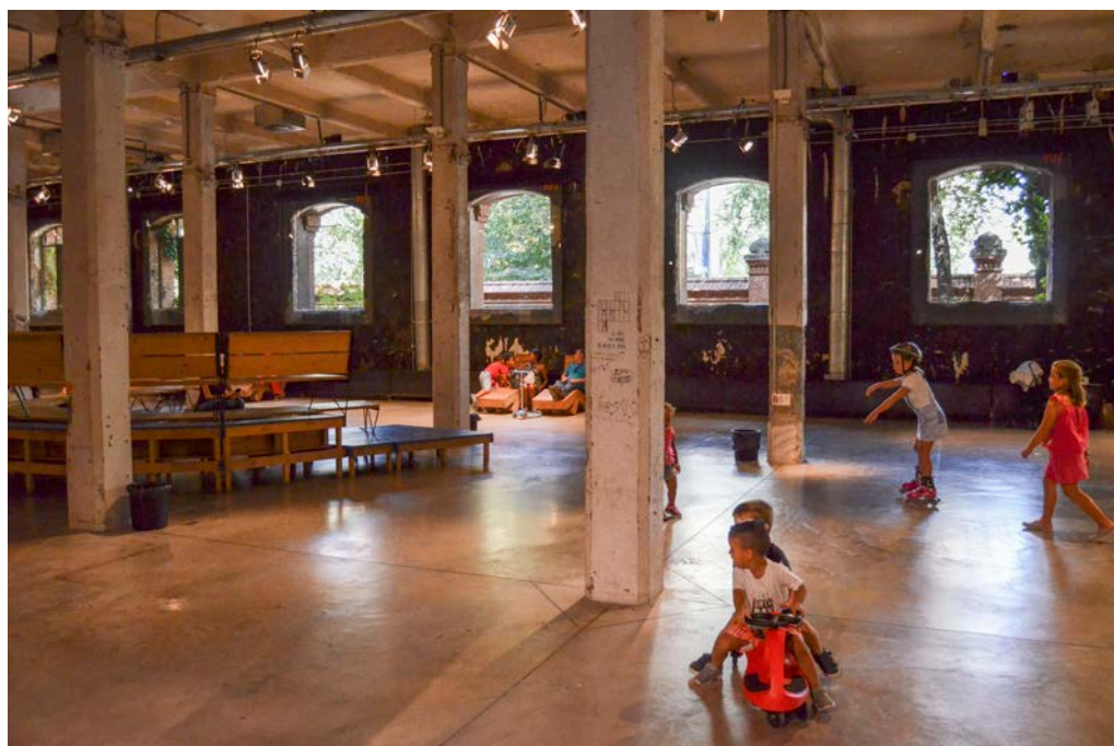
Foto 7. Niños jugando en el interior de la nave 17c, en el espacio perteneciente a Intermediæ. Septiembre de 2018.

Muchas de estas acciones que generan comunidad giran en torno a la identidad que el edificio y su evolución han producido en el barrio y sus