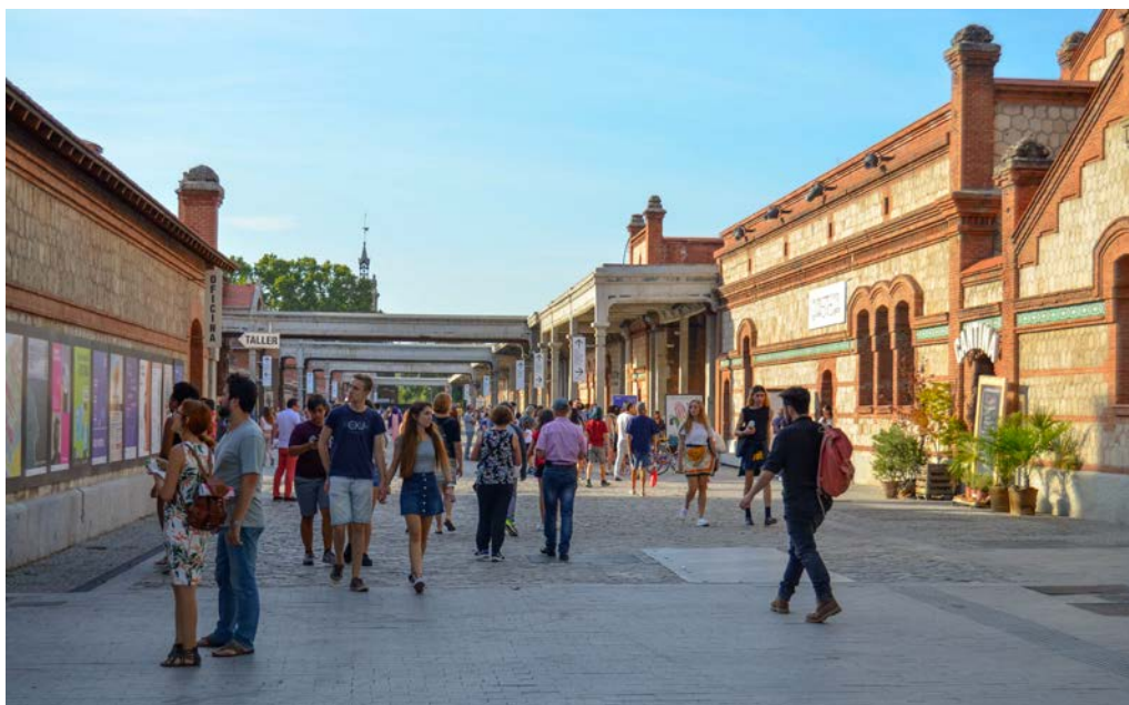
Foto 9. Ciudadanos recorriendo la calle Matadero. Septiembre de 2018. Elaboración propia.

en este lugar una gran diversidad de actividades artísticas y culturales que se entrelazan con los espacios de recuperación que los vecinos han integrado a su vida cotidiana (foto 9).