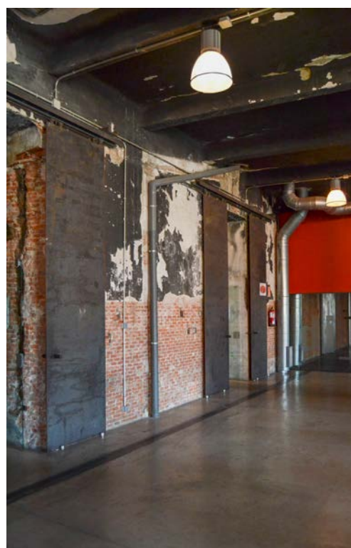
Foto 5. Intervención del interior de la nave 17c de Matadero (Antesala a Intermediæ y la Central de Diseño). Septiembre de 2018. Elaboración propia.