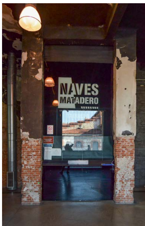
Foto 4. Intervención del interior de la nave 17c de Matadero (Taquilla del Centro Internacional de Artes Vivas). Septiembre de 2018. Elaboración propia.

El proyecto para la rehabilitación de la nave 17c de Matadero, la primera que sería intervenida, fue muy receptivo a las particularidades del espacio y su condición de ruina. En gran medida, esto se debió al proyecto cultural que acompañaba al proyecto de rehabilitación: Intermediæ, la nueva institución creada en aquel momento por el Ayuntamiento de Madrid, tuvo como hilo conductor desde un principio el proceso y su valor «como mecanismo de experimentación, reflexión e intervención de la creación contemporánea» (Matadero Madrid; consultada el 16 de septiembre de 2018). El proceso se convirtió también en el concepto rector del proyecto arquitectónico.