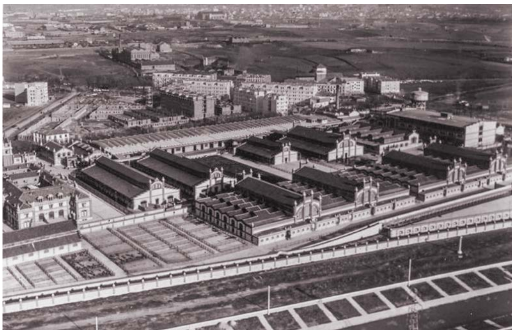
Foto 6. Vista aérea del Matadero Municipal, 1929. Autor: José Gaspar i Serra. En la imagen también se aprecia la barriada Pico de Pañuelo. CC. Biblioteca Digital Memoria de Madrid.

del río Manzanares (Instituto Geográfico Nacional; consultado el 17 de septiembre de 2018). Matadero dejaba de ser un espacio confinado y comenzaba a ser rápidamente absorbido por la ciudad, más nunca se integró a ella.