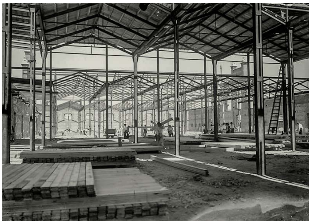
Foto 3. Obras en la Nave de exposición, venta y estabulación de cerdos del Matadero municipal, 1916. En la fotografía se puede observar la técnica constructiva y los materiales utilizados.

Con estos presupuestos, Bellido proyectó un conjunto de edificios industriales muy sencillos, pero de gran fuerza expresiva, en los que se «excluía todo elemento no indispensable a su objeto práctico» (Lasso de la Vega Zamora et al. , 2005: 149) y cuyos volúmenes expresaban con claridad su función y distribución interior resultando en una gran sinceridad y armonía espaciales. Lo anterior, unido al manejo de la luz, lograron dotar de cierta solemnidad a las distintas naves del matadero, cuyos protagonistas eran sin duda los modernos materiales utilizados para su construcción (foto 3).