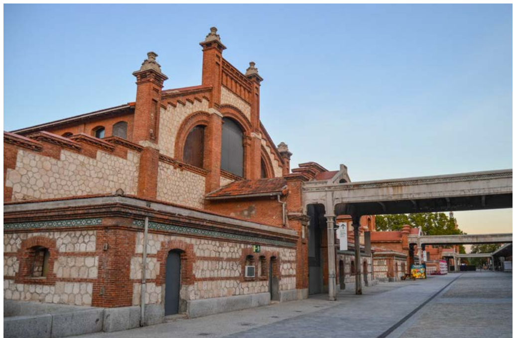
Foto 2. Exterior de las naves de Matadero Madrid. Septiembre de 2018.

Tras recibir el encargo, Bellido decidió realizar un viaje de investigación de campo por Alemania, Francia, Inglaterra, Bélgica, Italia y Portugal, en el que llegó a la conclusión de que, efectivamente, el modelo alemán de mataderos era el que resultaba más conveniente para solucionar los requerimientos